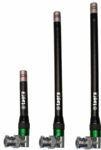
Distintos modelos disponibles