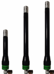
Distintos modelos disponibles