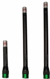
Distintos modelos disponibles