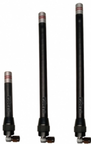
Distintos modelos disponibles