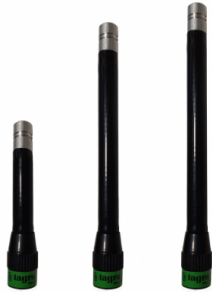
Distintos modelos disponibles