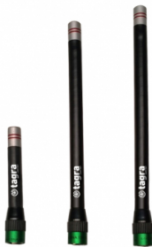
Distintos modelos disponibles