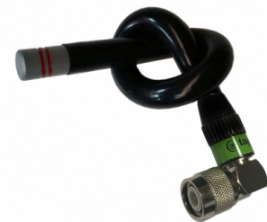
Distintos modelos disponibles