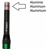
Aluminio Aluminum Aluminium