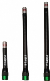
Distintos modelos disponibles