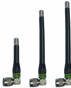
Distintos modelos disponible