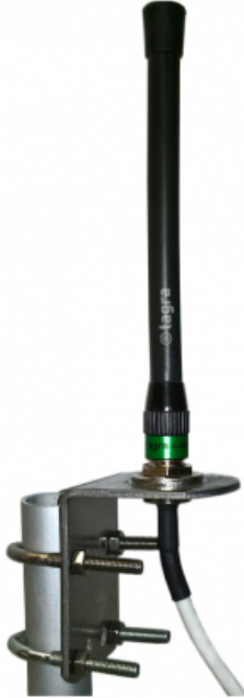
Tubo y soporte en INOX