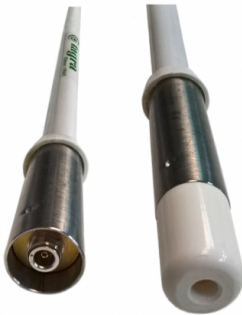
Tubo y soporte en INOX