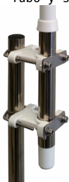
Tubo y soporte en INOX