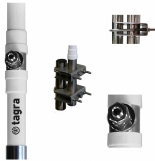
Detalle del conector y montaje