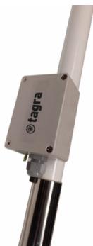
Caja BOX HF-1 (no incluida)