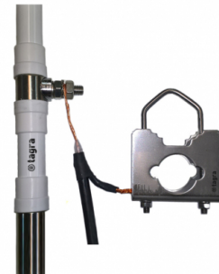
Ejemplo de conexión