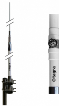
Incluye dos tramos de 3 metros