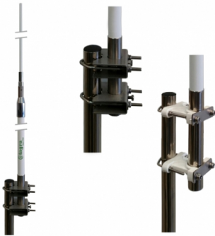
Tubo y soporte en INOX