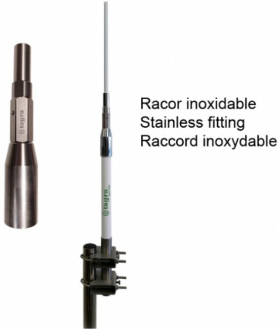
Racor inoxidable Stainless fitting Raccord inoxydable