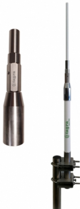
Racor inoxidable Stainless fitting Raccord inoxydable