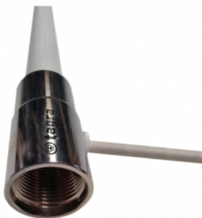
Detalle del conector